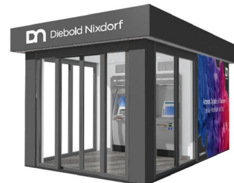
Minifilialen auf Stahl- und Glasbasis Modell CASH-POINT PAVILION

Alle Modelle bieten höchste Qualitätsstandards und entsprechen ebenfalls der Schutzklasse III.