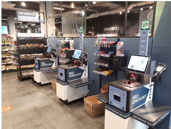
Self-Checkout Systeme im neuen Combi City Format in Oldenburg

Neben den klassischen Bedienkassen sind die ersten BEETLE /iScan EASY eXpress Systeme in vier Combi Märkten im Einsatz und erfreuen sich einer hohen Kundenakzeptanz. Insbesondere bei kleineren Warenkörben können die benutzerfreundlichen Selbstbedienungskassen die Kassenkräfte entlasten. Zudem helfen sie den Kunden, Zeit beim Bezahlvorgang einzusparen.