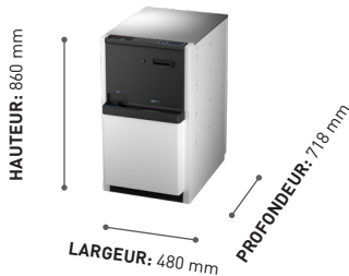
Cash Rack autonome

Hauteur: 860 mm Largeur: 480 mm Profondeur: 718 mm